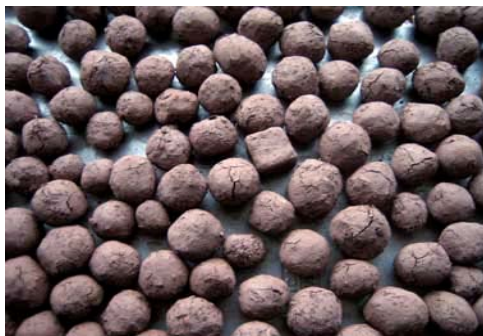
Semillas cubiertas de arcilla

Idealmente suele haber una semilla por bolita. En un día es posible hacer suficientes bolitas para sembrar algunas hectáreas. Dependiendo de las condiciones, a veces también recubro con arcilla formando bolitas las semillas de otros cereales y hortalizas antes de sembrarlas. Entre mediados de noviembre y mediados de diciembre es una buena fecha para sembrar a voleo, entre las jóvenes plantas de cebada o centeno, las bolitas conteniendo las semillas de arroz pero también pueden sembrarse en primavera. (El arroz se siembra en dosis de 20 a 40 g./Ha. Hacia finales de Abril el Sr. Fukuoka revisa la germinación de la semilla sembrada en otoño y esparce más bolitas de semilla si es necesario).