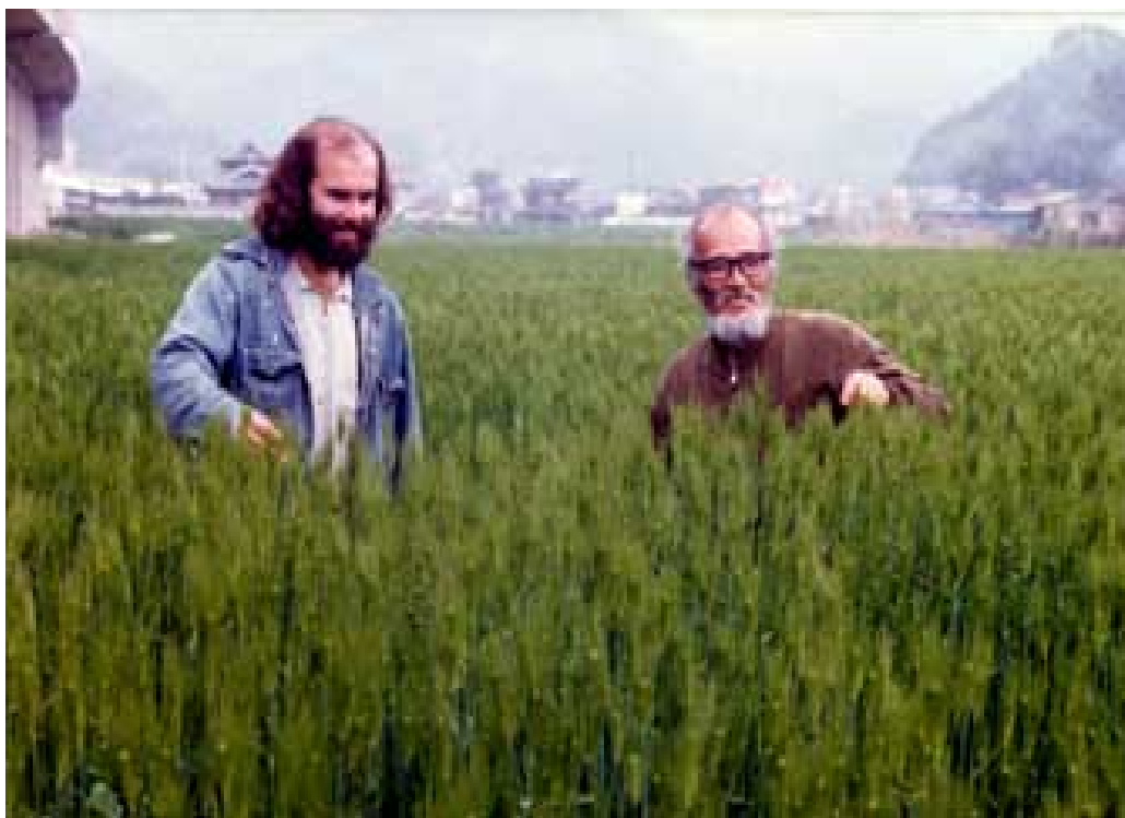
Larry y Fukuoka observan campo de arroz

Traducción de trabajo del libro: THE ONE-STRAW REVOLUTION, AN INTRODUCTION TO NATURAL FARMING, de MASANOBU FUKUOKA, publicado por RODALE PRESS 1978.